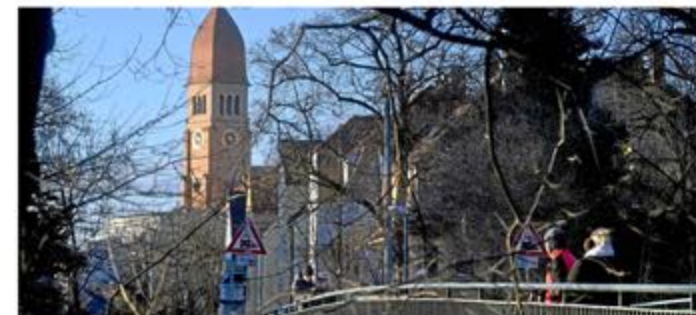
Schöner Blick auf Pfersee von der Wertachbrücke.